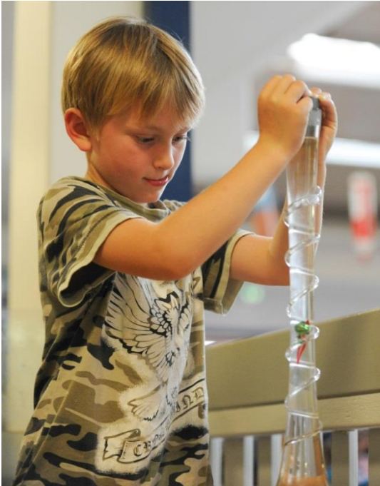
So funktioniert das also mit dem Wasserdruck, findet hier ein Junge heraus.

in die praktische Arbeit einbezogen. Oft werden sie von lokalen Sponsoren finanziell, materiell oder mit Wissen unterstützt. Durch das gemeinsame Nachbauen können nachhaltige Lernpartnerschaften zwischen Schule, Eltern und Wirtschaft entstehen. Naturwissenschaft und Technik werden zum selbstverständlichen Lern- und Gesprächsanlass.