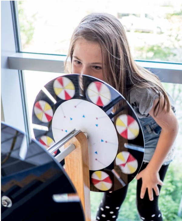
Schauen, anfassen, ausprobieren – so läuft das bei der „MINIPHÄNOMENTA in Bayern“.