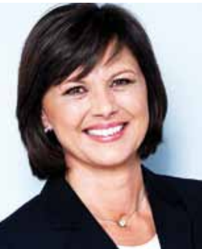
Ilse Aigner Bayerische Staatsministerin für Wirtschaft und Medien, Energie und Technologie

Um hier zukunftsgerichtete Konzepte und Lösungen zu entwickeln und insgesamt diese technologischen Möglichkeiten zu nutzen, benötigen wir gut ausgebildete Fachkräfte auf allen Ebenen.