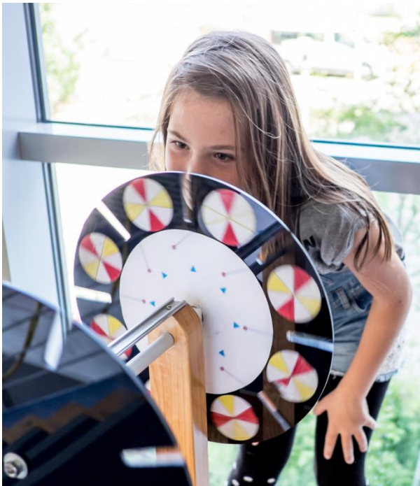
Schauen, anfassen, ausprobieren – so läuft das bei der „MINIPHÄNOMENTA in Bayern“.