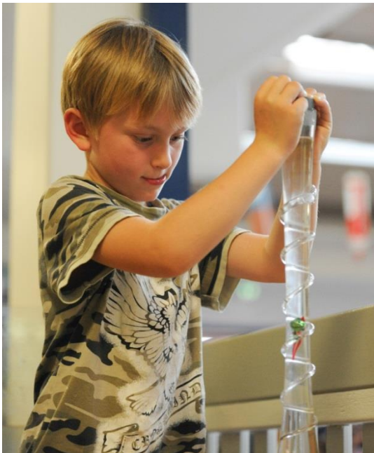
So funktioniert das also mit dem Wasserdruck, findet hier ein Junge heraus.

Wochen, nachdem die MINIPHÄNOMENTA zu Gast war. Auf diese Weise werden Eltern in den pädagogischen Prozess und in die praktische Arbeit einbezogen. Oft werden sie von lokalen Sponsoren finanziell, materiell oder mit Wissen unterstützt. Durch das gemeinsame Nachbauen können nachhaltige Lernpartnerschaften zwischen Schule, Eltern und Wirtschaft entstehen. Naturwissenschaft und Technik werden zum selbstverständlichen Lern- und Gesprächsanlass.