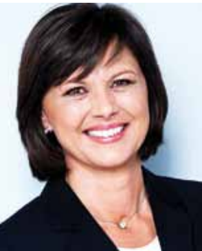
Ilse Aigner Bayerische Staatsministerin für Wirtschaft und Medien, Energie und Technologie

Um hier zukunftsgerichtete Konzepte und Lösungen zu entwickeln und insgesamt diese technologischen Möglichkeiten zu nutzen, benötigen wir gut ausgebildete Fachkräfte auf allen Ebenen.